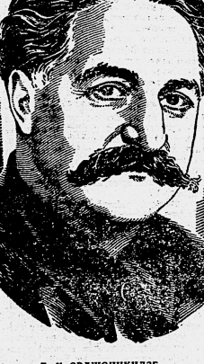
Г. К. ОРДЖОНИКИДЗЕ

В последнее время в торгующих организациях наблюдается рост коммунистической работы среди рабочих. В последнее время в торгующих организациях наблюдается рост коммунистической работы среди рабочих.