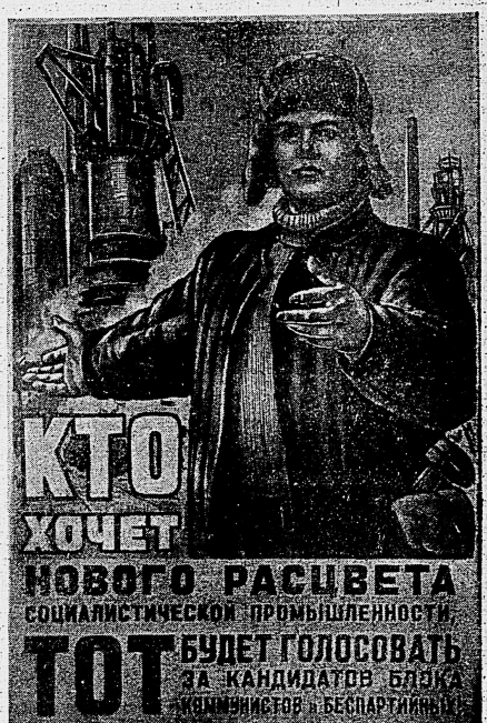
Плакат художника Л. Голованова, выпущенный издательством «Искусство»