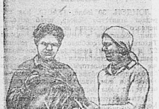
Богатый урожай хлеба нарабатывали в этом году колхозники сельхозартели «Ветеран» Ленинского района.

Важнейшее условие — это состояние дорог. Если дороги будут в плохом состоянии, то уборка урожая будет затруднена. Поэтому необходимо уделять особое внимание ремонту и содержанию дорог.