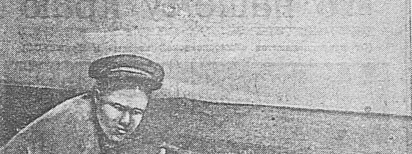
В УСТЬ-МАГАДАНСКОМ РАЙПРОМХОЗЕ. На снимке: разгрузка свежего улова рыбы.

В бригадах нефтяников Охи и Сахалина достигли значительных успехов в работе. В бригадах нефтяников Охи и Сахалина достигли значительных успехов в работе.