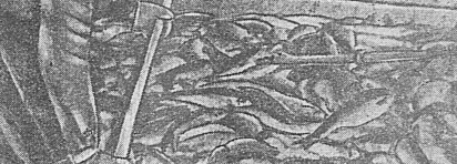
В УСТЬ-МАГАДАНСКОМ РАЙПРОМХОЗЕ. На снимке: разгрузка свежего улова рыбы.