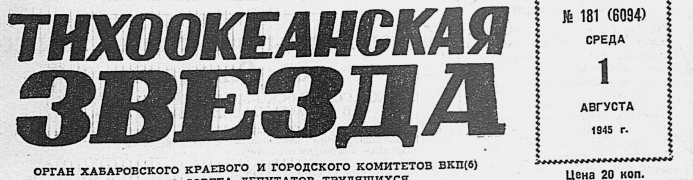
ОГАН ХАБАРОВСКОГО КРАЕВОГО И ГОРОДСКОГО КОМИТЕТОВ ВКП(б) И КРАЕВОГО СОВЕТА ДЕПУТАТОВ ТРУДЯЩИХСЯ

№ 181 (8094) СРЕДА 1945 г. АВГУСТА 20 коп.