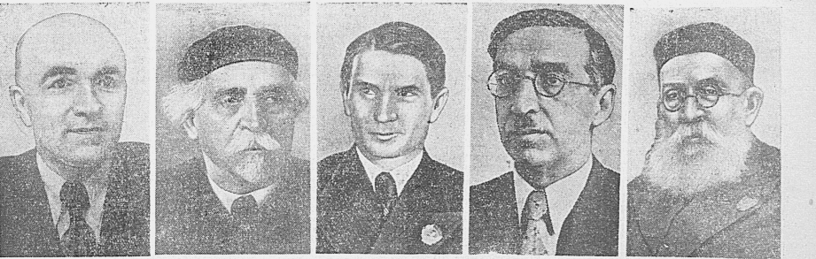
ГЕРОИ СОЦИАЛИСТИЧЕСКОГО ТРУДА: 1. Академик И. М. ВИНГРАДОВ, 2. Академик Н. Д. ЗЕЛИНСКИЙ, 3. Академик Т. Д. ЛЫСЕНКО, 4. Академик Н. И. МУХЕЛИШВИЛИ, 5. Академик А. Е. ФАВОРСКИЙ.

Господину Стеттиниусу Государственному Секретарю США САН-ФРАНЦИСКО. Шлю Вам наилучшие пожелания и выражение признательности в связи с третьей годовщиной заключения Советско-Американского Соглашения о принятии, являющегося основой от Советского Инициативы и от меня лично. В этот день, будучи особенно уверен, что Вы как выдающийся руководитель Управления по осуществлению программы о передаче в аренду или займам вооружения, сделали очень много для снабжения Красной Армии оружием, стратегическим материальным и продовольственным. Рамы этой помощи и хорошая организация всего этого дела сыграли весьма значительную роль в разгроме гитлеровской Германии.