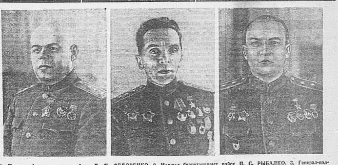
ПОЛКОВОДЫ КРАСНОЙ АРМИИ. 1. Маршал Бронетанковых войск Л. П. ФЕДОРЕНКО. 2. Маршал бронетанковых войск П. С. РЫБАЛКО. 3. Генерал-полковник П. И. БАТОВ. 4. Генерал-лейтенант авиации Г. Ф. БАДКУРОВ.