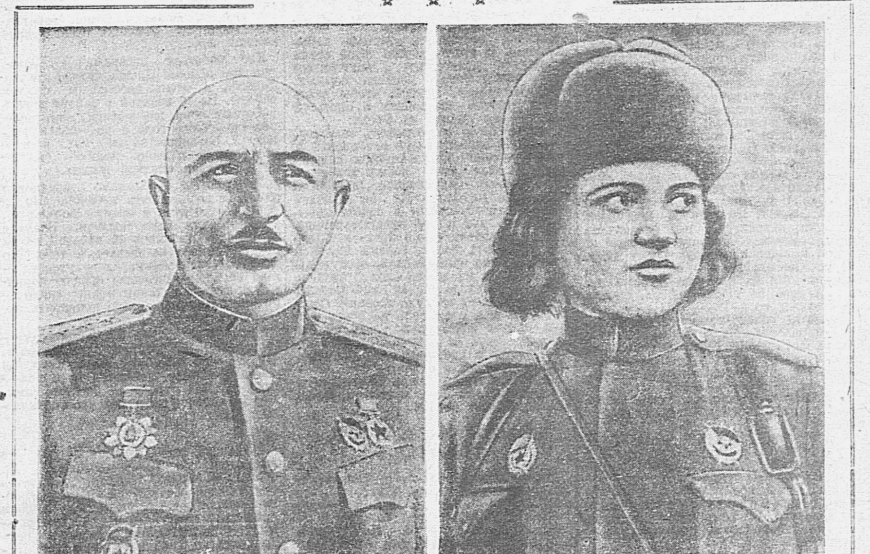
Славные воины Красной Армии. На снимках: 1. Гвардия генерал армии Иван Христофорович БАГРАМЯН. Под его командованием войска 1-го Прибалтийского фронта прорвали сильно укрепленную оборонительную полосу противника южнее Невеля...