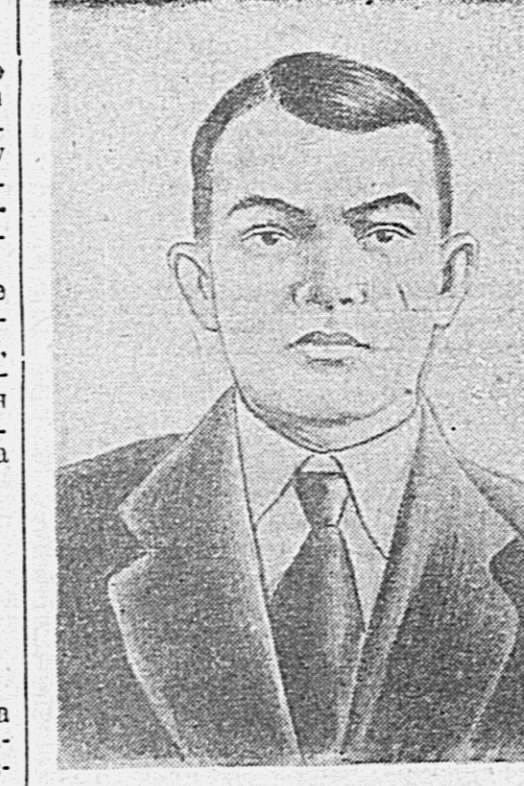
80 тысяч рублей экономии