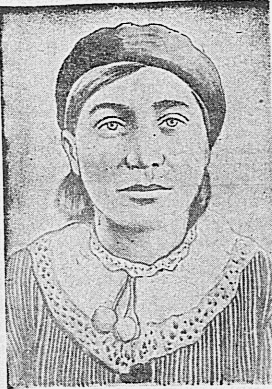
Предложение бывшей домохозяйки