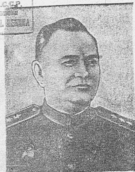
НА ФРОНТАХ ОТЕЧЕСТВЕННОЙ ВОЙНЫ. На снимках: 1. Кавалер ордена Суворова первой степени генерал-полковник интендантской службы А. В. Хрулев. 2. На Днепре. Бойцы Энской части ведут огонь по немцам. 3. Генерал-лейтенант А. А. Гречко.

Участники совещания пополнили учебный материал, рассказали о том, как парткабинеты помогают руководителям кружков и комундистам,