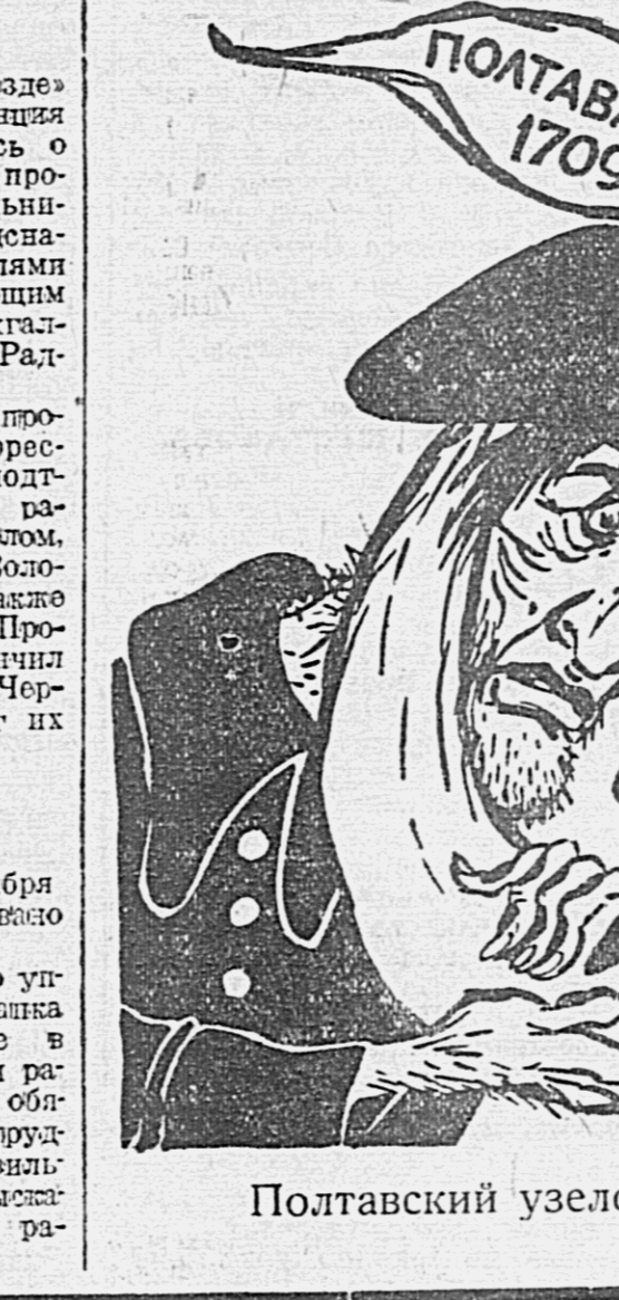
Полтавский узелок на память об Украине. Рисунок В. Павчинского.

«В 1709 году — 234 года тому назад — под Полтавой Пётр Первый разгромил уничтожил армию Карла XII. 23 сентября 1943 года Красная Армия освободила Полтаву от гитлеровских захватчиков».