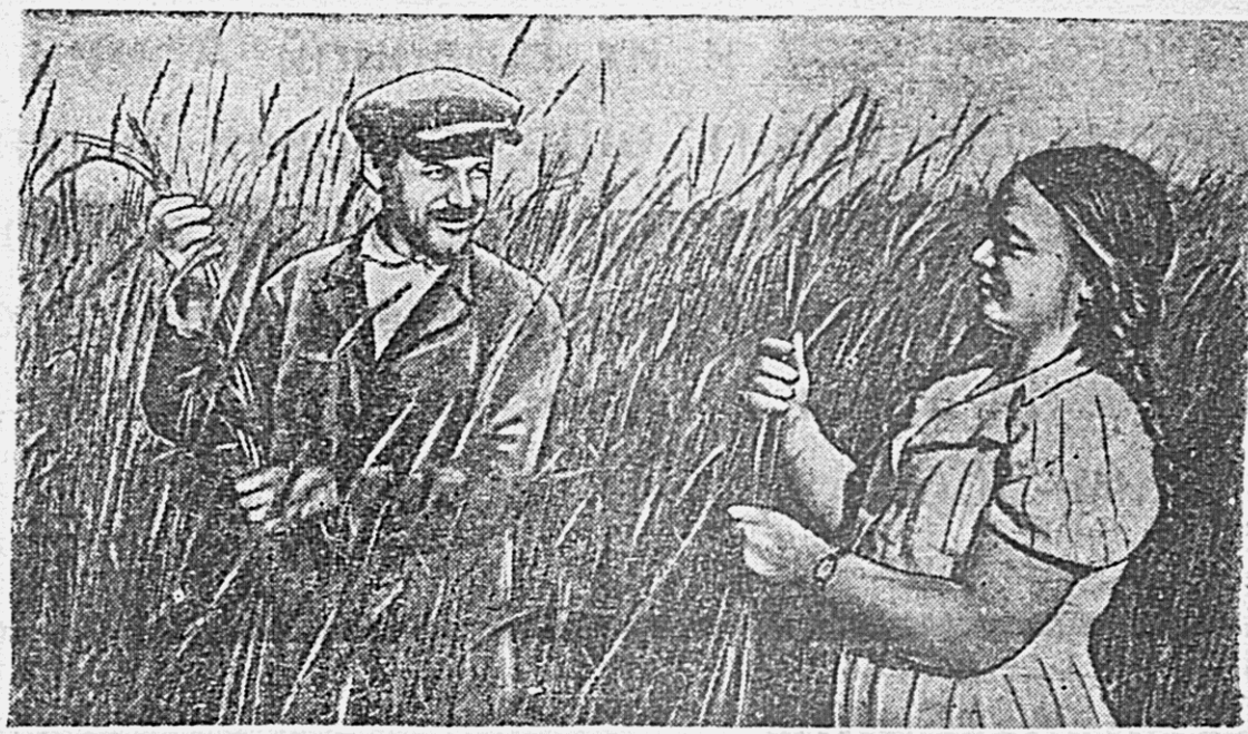
Колхоз «Вторая пятилетка», Хабаровского сельского района, в прошлом году впервые посеял 10 гектаров озимой ржи...