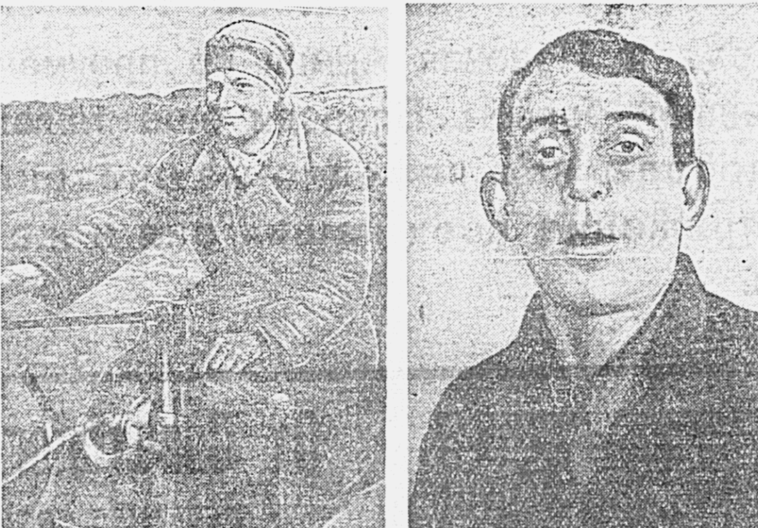
НА ПОЛЯХ НАШЕГО КРАЯ. На снимках: 1. Молодая трактористка колхоза «Эмекс», Биробиджанского района...