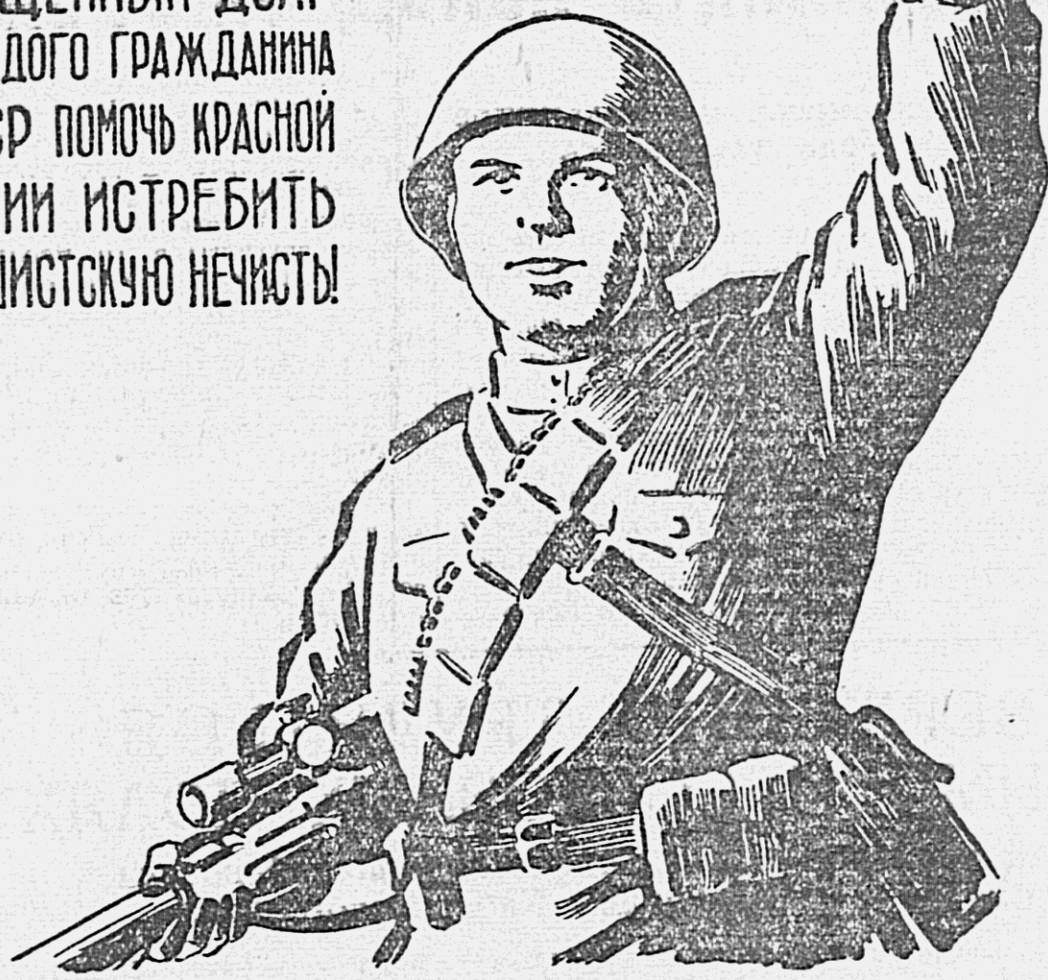
Памят работы художника Л. Дешев.

СВЯЩЕННЫЙ ДОЛГ КАЖДОГО ГРАЖДАНИНА СССР ПОМОЧЬ КРАСНОЙ АРМИИ ИСТРЕБИТЬ ФАШИСТСКУЮ НЕЧИСТЬ!