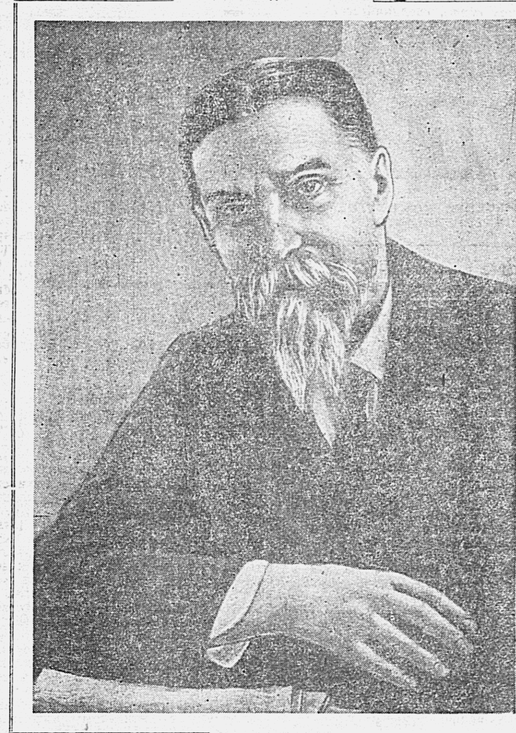
К. А. Тимирязев

Нам Родине переживает сейчас грозное время. Советский народ в упорной борьбе с врагом отстаивает свою честь, свободу и независимость. С полной верой в победу можно сказать, что для торжества идеи Тимирязева, для развития социалистического земледелия в будущем открываются самые широкие перспективы. Мне остается передать горячее пожелание, чтобы наша наука и культура изучала Тимирязева, чтобы больше читала его в полнине. Нужно знать Тимирязева, помнить, за что он боролся, чему посвятил всю свою светлую жизнь и каждому по мере сил следовать его примеру.