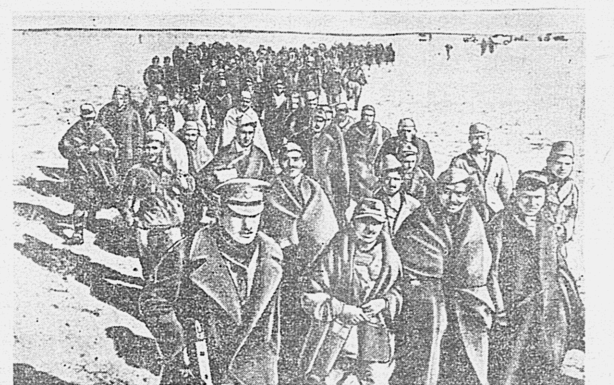
Военные действия в Тунисе. Захватившие союзными войсками пленные немецкие и итальянские солдаты из армии Роммеля.