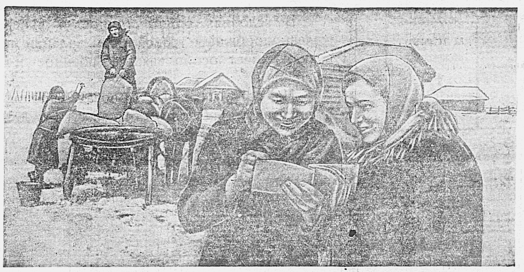
Взаимная помощь колхозников Благовещенского района в подготовке к севу. Колхоз «Красная нива» дает взаимы сельхозартелю «Земледелец» 120 центнеров семенной пшеницы.

Под семенные участки должны отводиться наиболее плодородные, легкие по механическому составу земли.