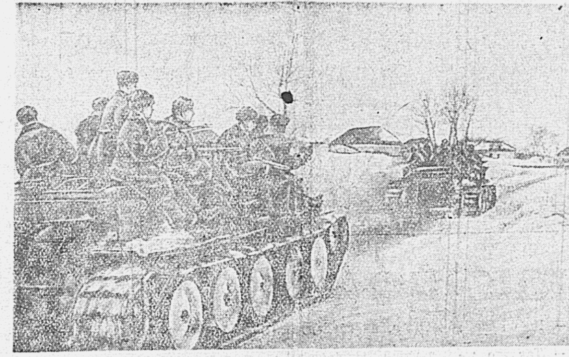
ДЕЙСТВУЮЩАЯ АРМИЯ № снимках: 1. Десант на танках отправляется на выполнение боевой задачи. 2. Отделение гвардии сержанта Горных преследует противника. (Кубань).