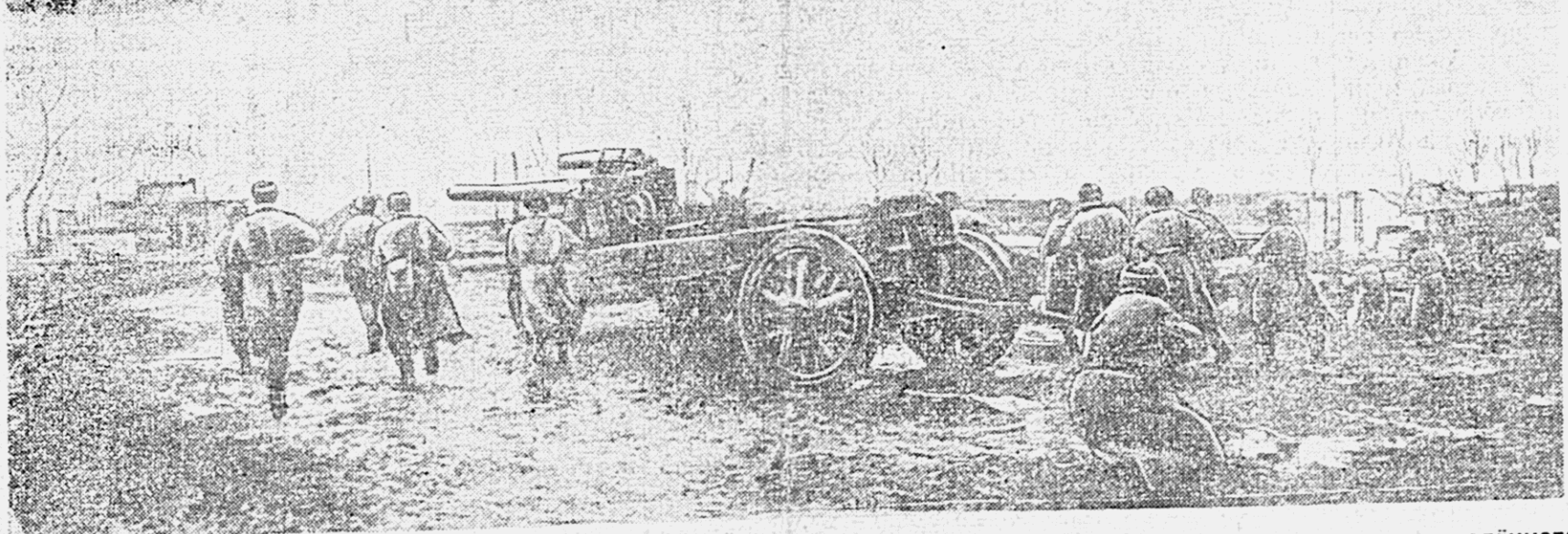
ДЕЙСТВУЮЩАЯ АРМИЯ. На снимке: подразделение гвардии капитана Седых выбивает немцев из населенного пункта на Кубани.

ПОЛМЕСЯЦА отделяет нас от великого пролетарского праздника 1 Мая. На заводах, фабриках, золотых приисках, нефтепромыслах, шахтах, рыбозаводах — повсюду растут и ширятся всенародное социалистическое соревнование. Оно подлинное социалистическое соревнование. Оно подлинное социалистическое соревнование. Оно подлинное социалистическое соревнование.