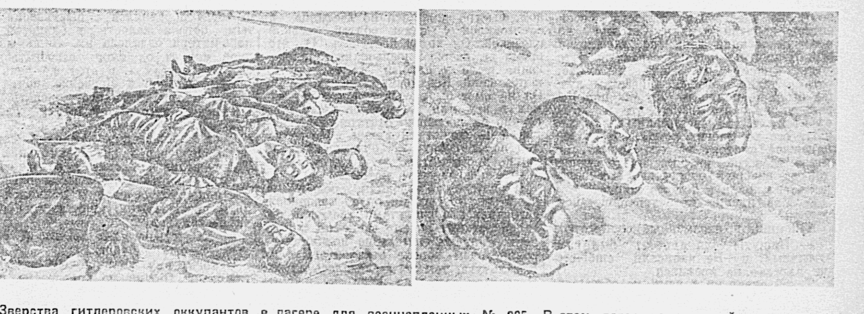
Зверства гитлеровских оккупантов в лагере для военнопленных № 205. В этом лагере за сградой из колодезной проволоки, в открытой заснеженной степи, находились советские люди — пленники красноармейцы, командиры и мирные жители. Звезд от рук фашистских палачей погибло мученической смертью 4.500 человек. На территории лагеря обнаружено 59 человеческих голов без туловищ. На снимке: трупы замученных и умирших в лагере от холода и голодной смерти (слева) и три отрубленные головы с проломами в черепе.