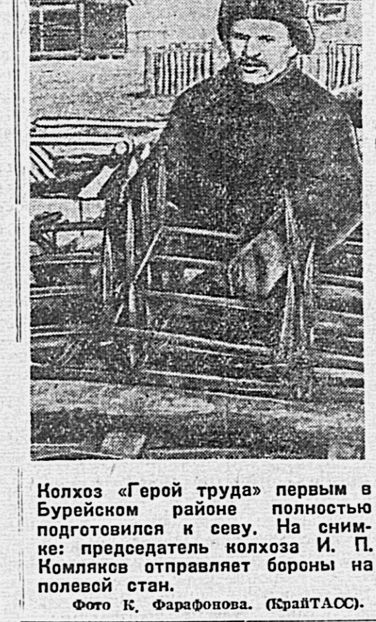
Колхоз «Герой труда» первым в Бурейском районе полностью подготовился к севу.