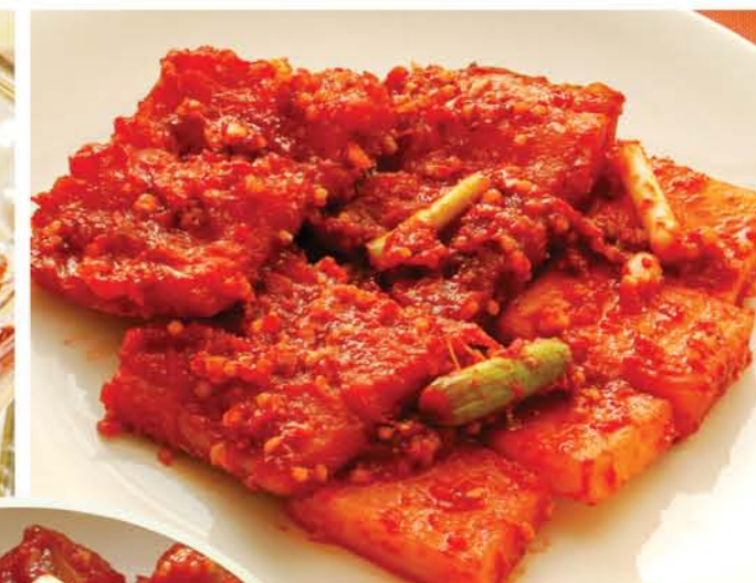
Сикхе из сома Fermented Hot Catfish