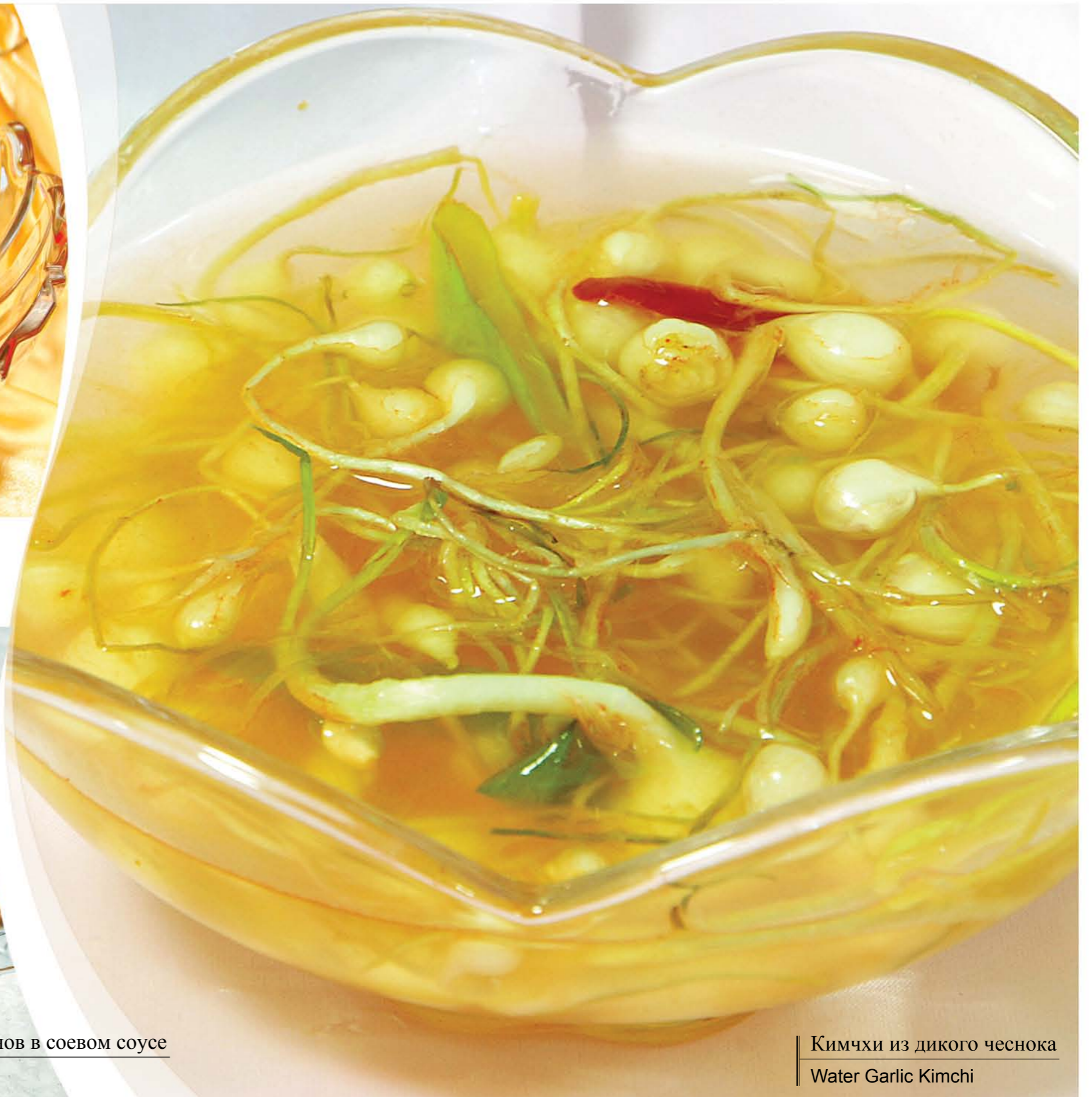
Кимчи из дикого чеснока Water Garlic Kimchi