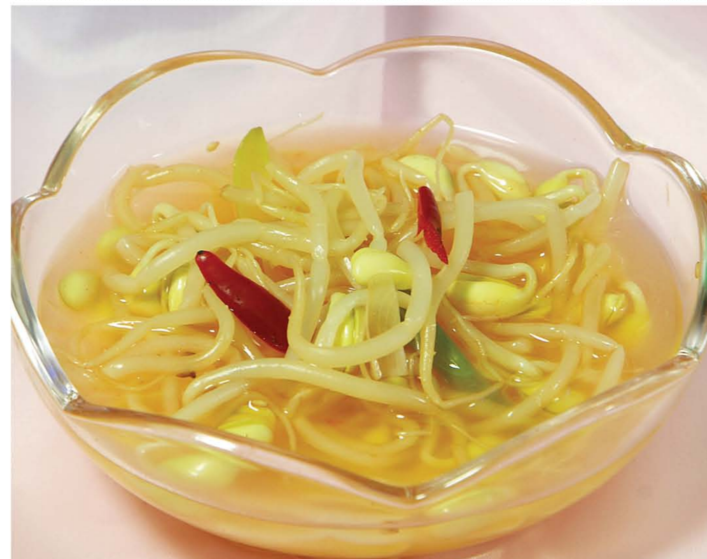
Кимчи из ростков соевых бобов Bean Sprouts Kimchi