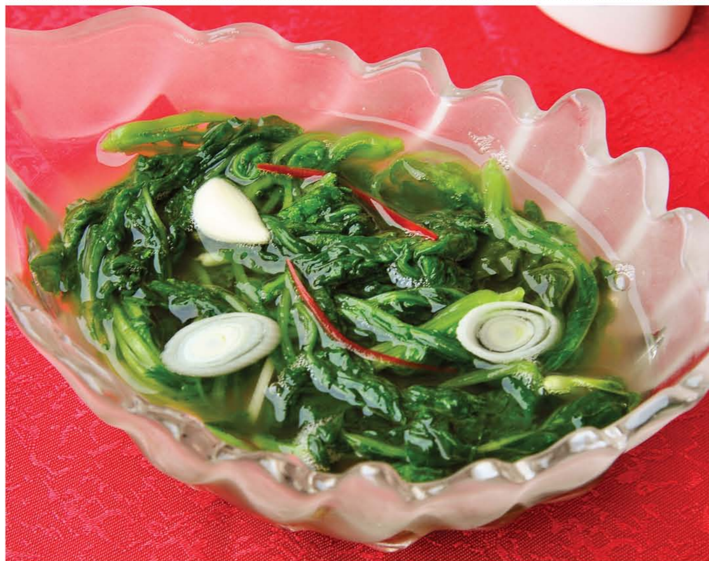
Кимчи из молодой капусты Young Radish Leaf Kimchi