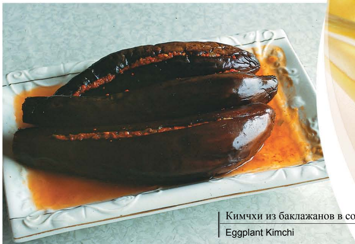
Кимчи из баклажанов в соевом соусе Eggplant Kimchi