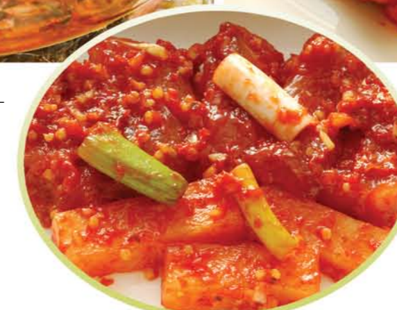
Сикхе из минтая Fermented Hot Pollack