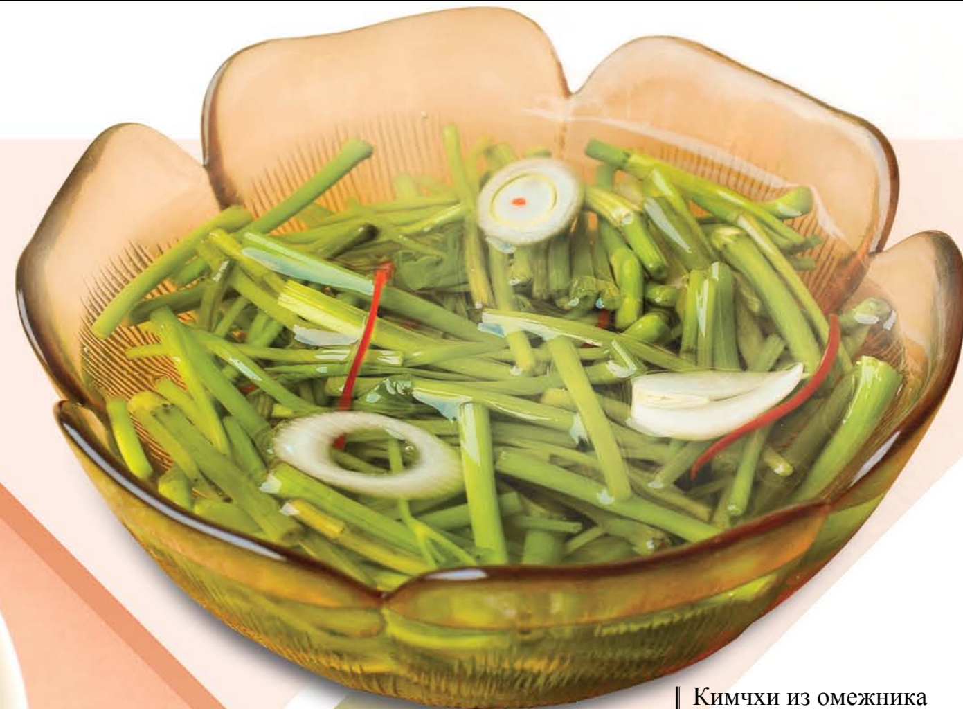
Кимчи из омежника Dropwort Kimchi