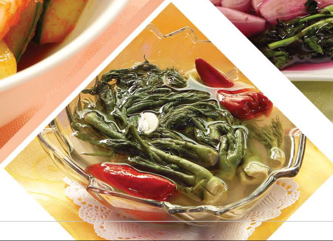
Кимчи из молодых побегов аралии Aralia Shoots Kimchi