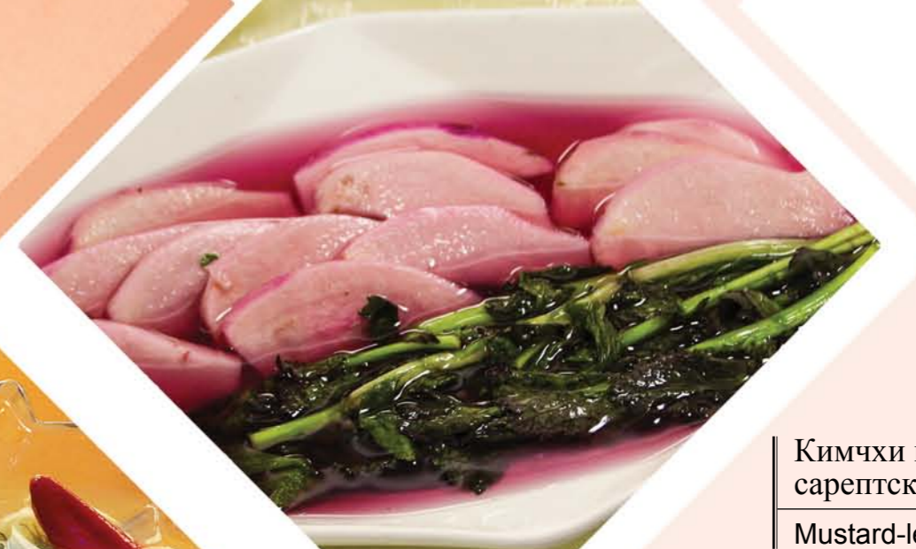
Кимчи из горчицы сарептской Mustard-leaf Kimchi