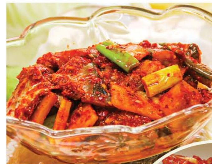
Сикхе из власозуба Fermented Hot Sandfish