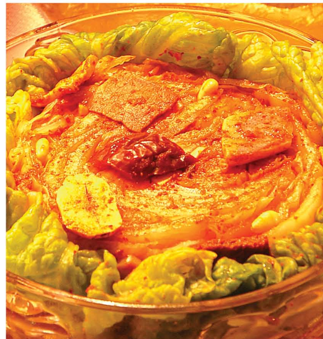
Кимчи из овощей, завернутых в капустные листья Possam Kimchi