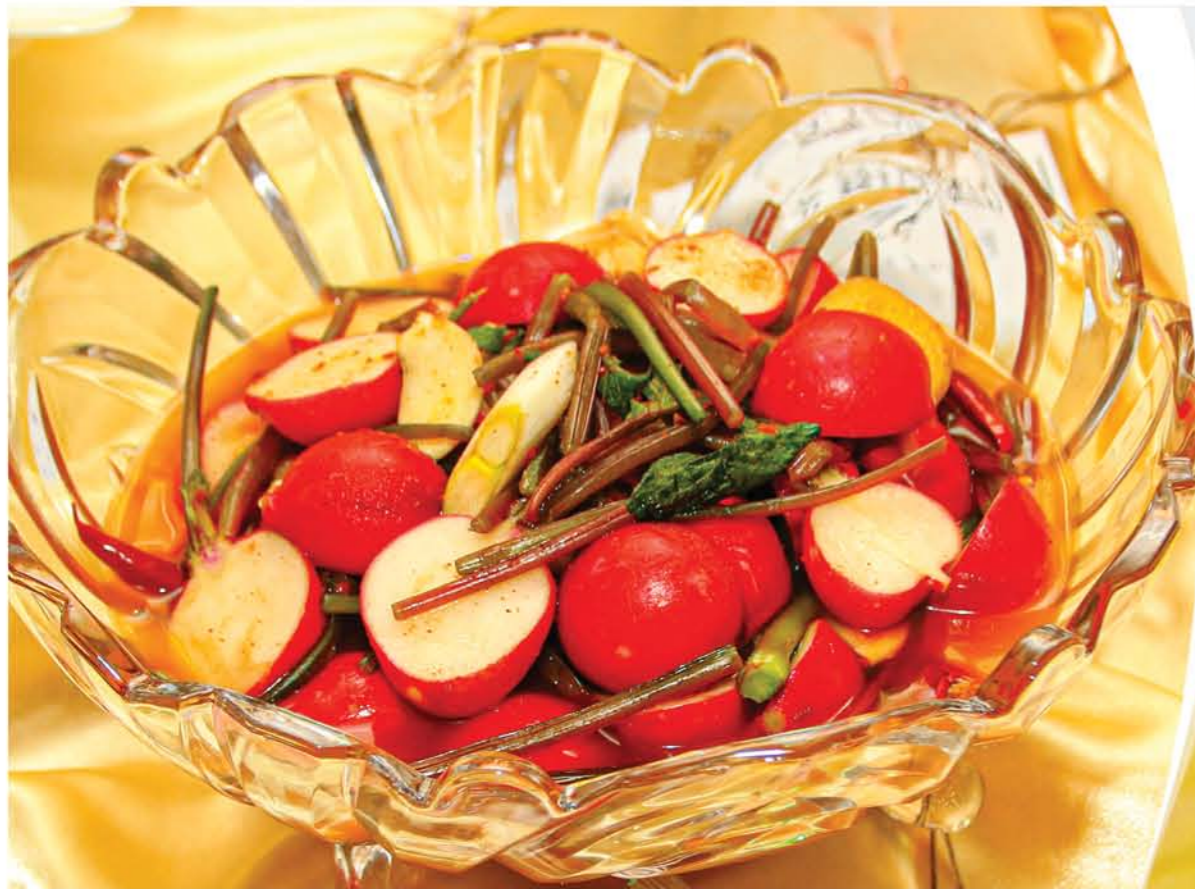
Кимчи из весенней красной редьки Red Radish Kimchi