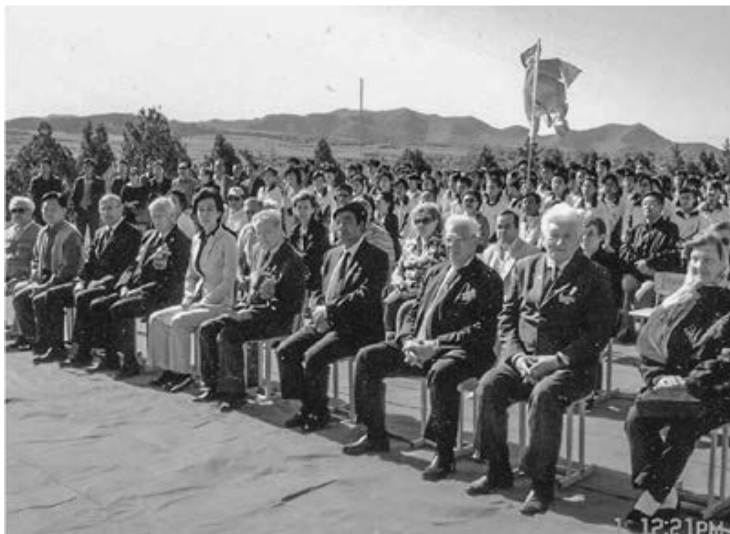
Группа ветеранов 88-й бригады на родине её героя — Чжао Шанчжи. КНР, провинция Хэйлунцзян, городской уезд Шанчжи. Сентябрь 2013 года.

тографии, личные вещи, книги, связанные с 88-й отдельной стрелковой бригадой. В 2015 году поддержавшая местную инициативу китайская сторона согласовала с российскими властями вопрос о строительстве в селе Вятском мемориала, посвящённого бойцам 88-й бригады.