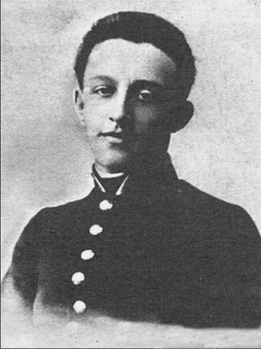
А.А. Блок. Фото 1898