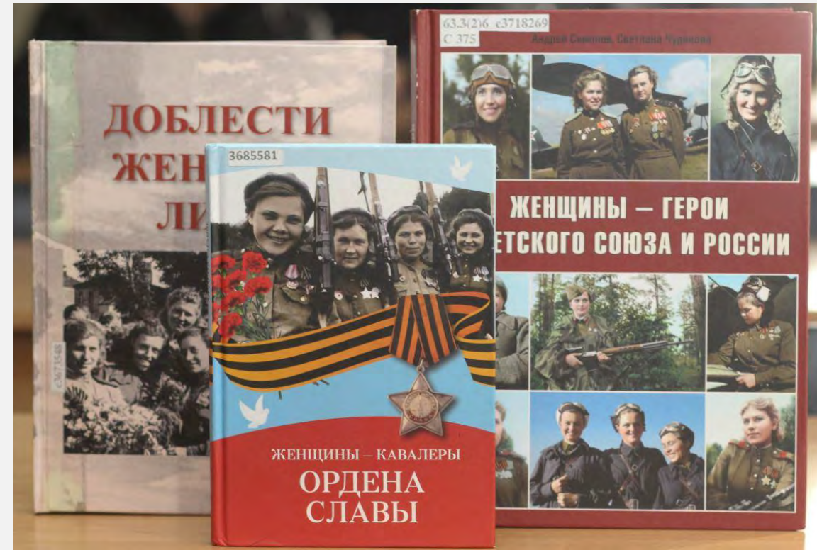
«Женское лицо Победы»