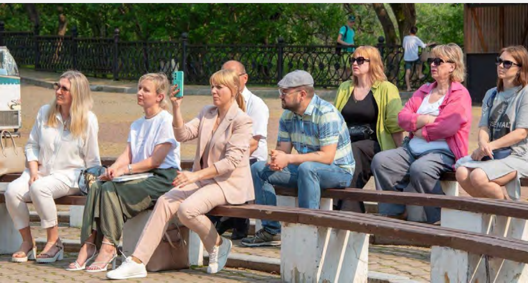
«Жизнь за други своя»