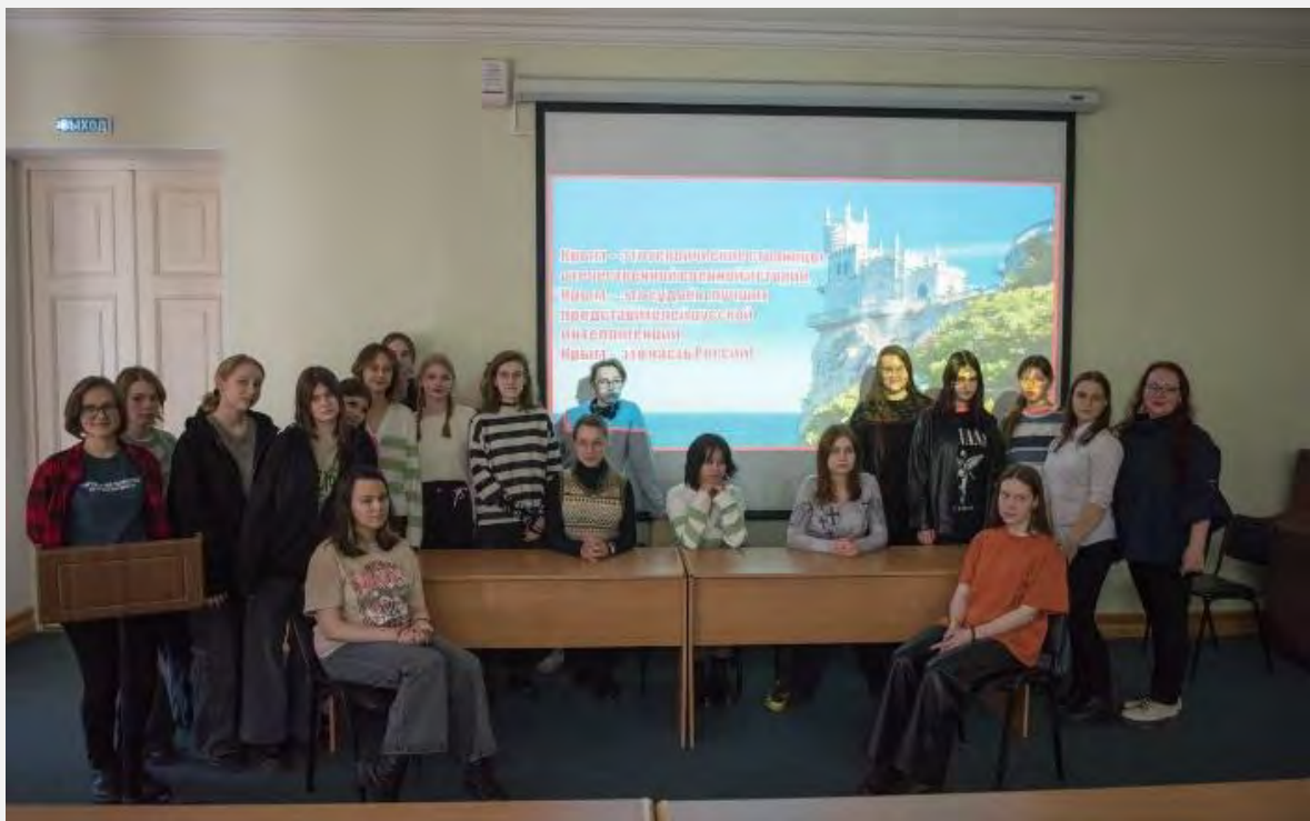
«Культурное наследие Крыма»