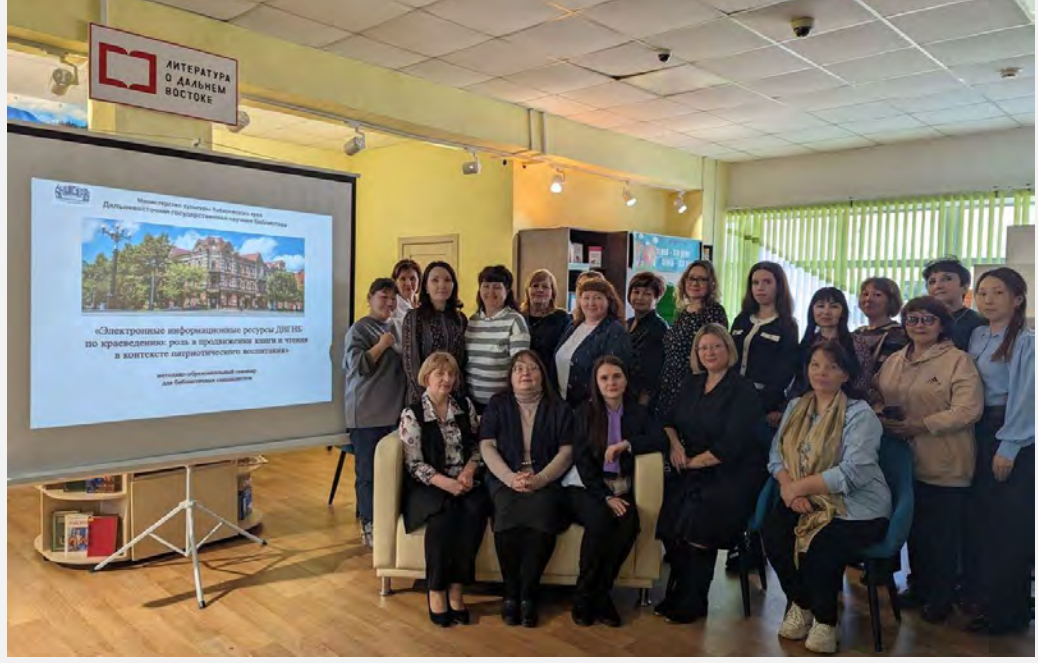
«Электронные информационные ресурсы ДВГНБ по краеведению: роль в продвижении книги и чтения в контексте патриотического воспитания»