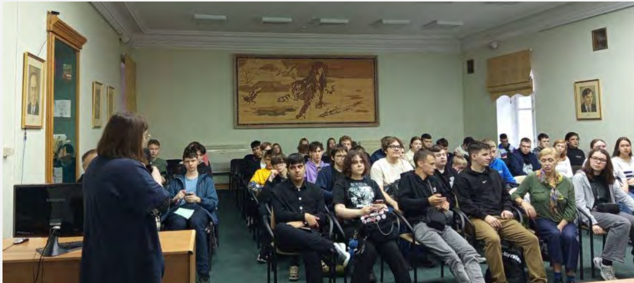
«Хабаровский процесс: Нюрнберг на Амуре»