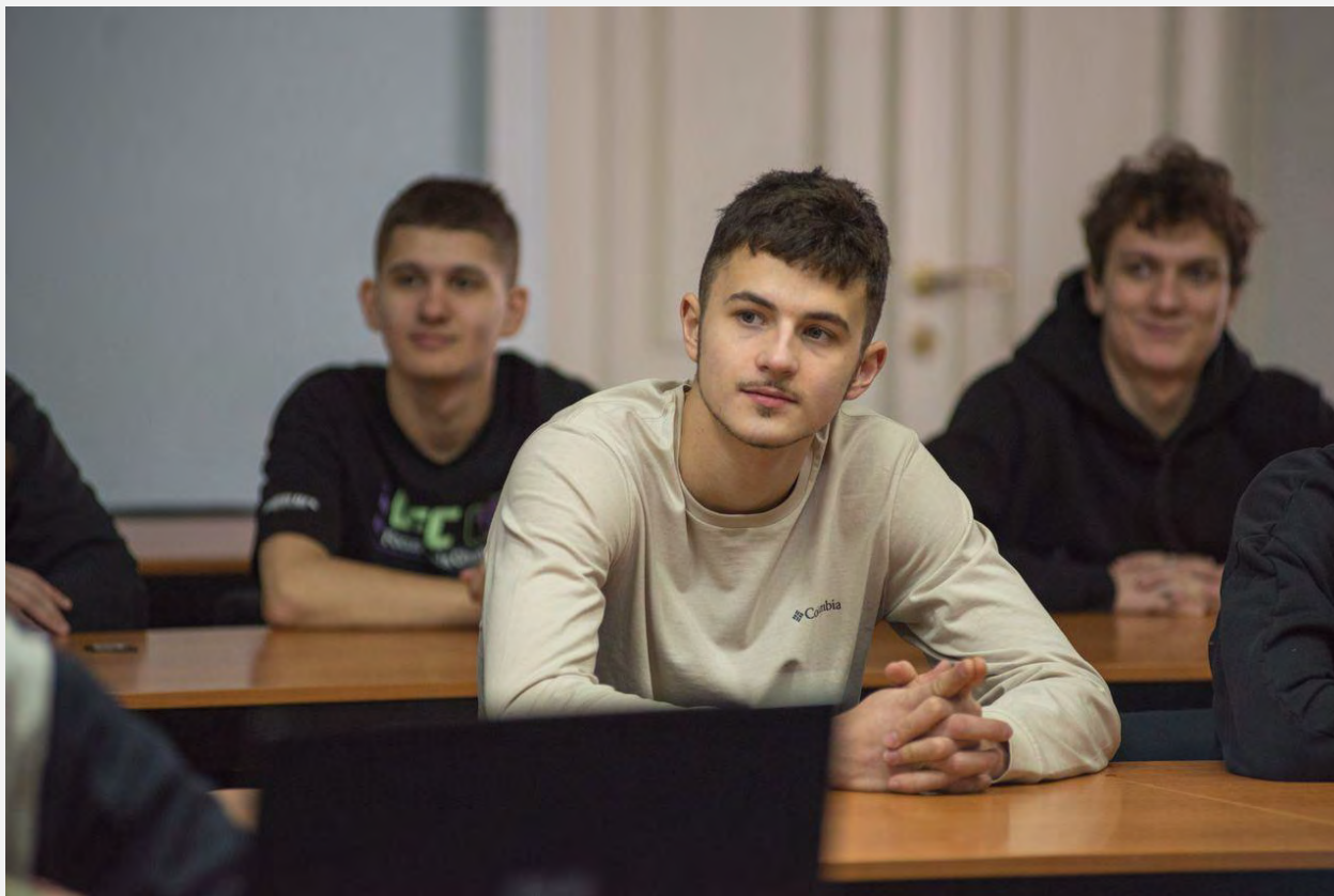
«Военная доблесть Хабаровского края»