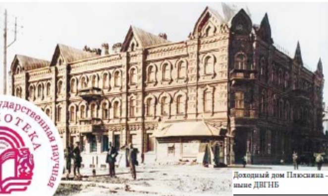
Доходный дом Плеховина – ныне ДВГНБ