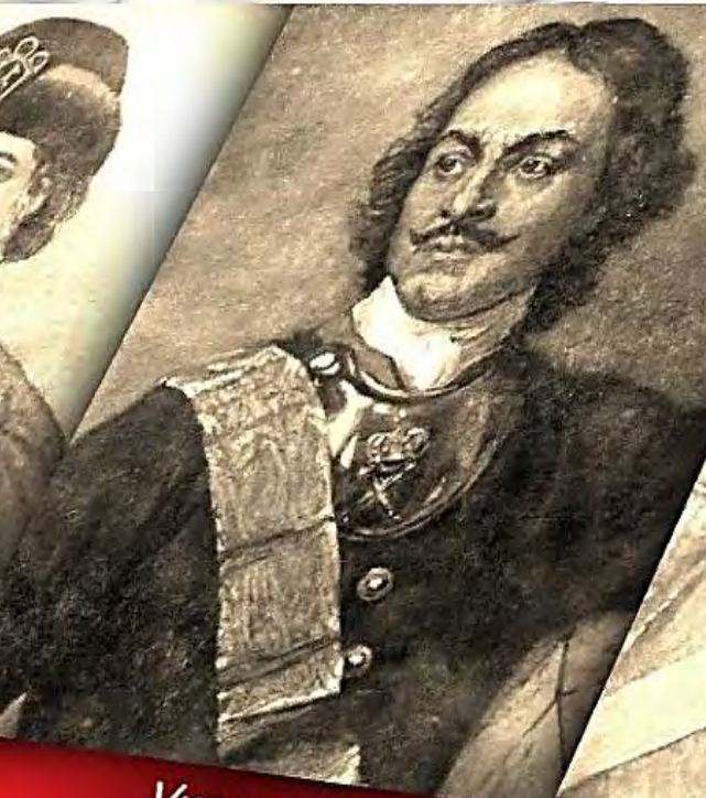
Указы Петра I XVIII в