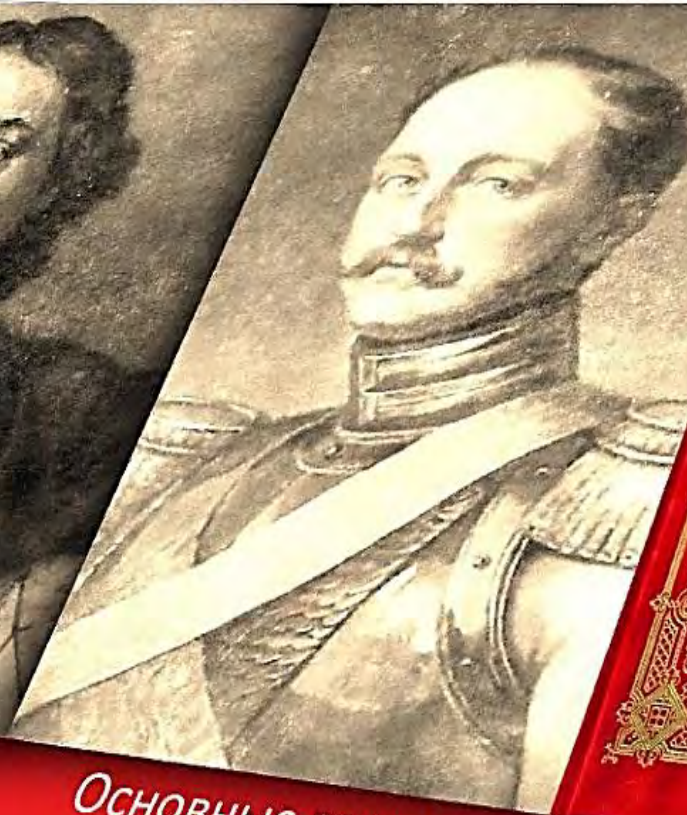
Основные законы Российской Империи XIX в (Николай I)