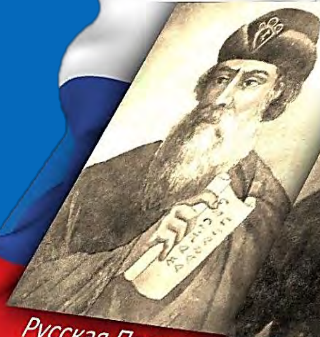
Русская Правда XI в