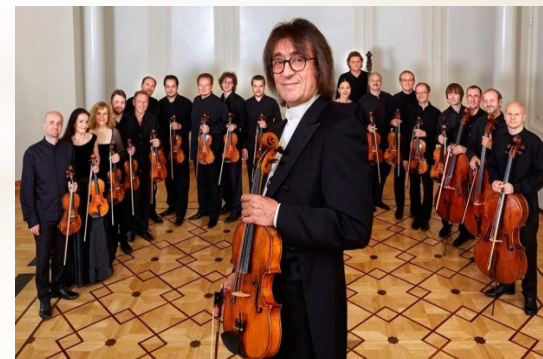
Юрий Башмет и камерный ансамбль «Солисты Москвы»

Башмет записал более 40 музыкальных дисков с исполнением различных произведений. Кино- и телекомпании России, Англии и Франции сняли несколько фильмов о его творчестве.