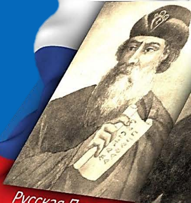
Русская Правда XI в