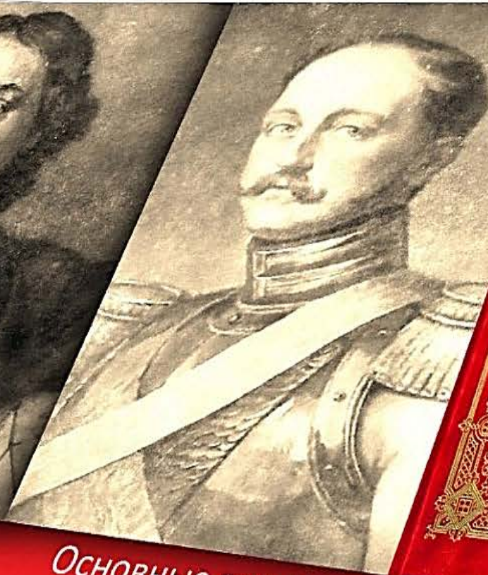
Основные законы Российской Империи XIX в (Николай I)