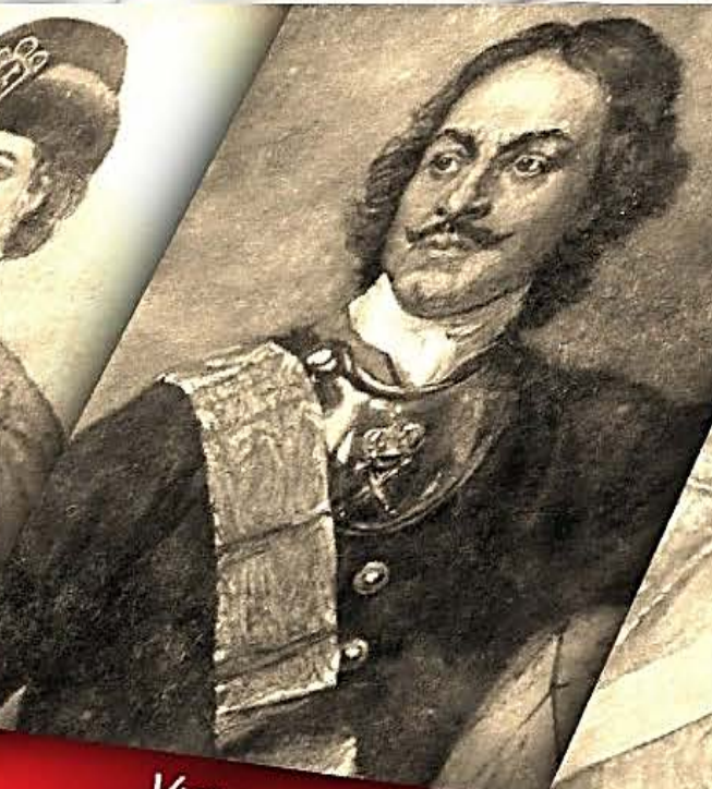
Указы Петра I XVIII в