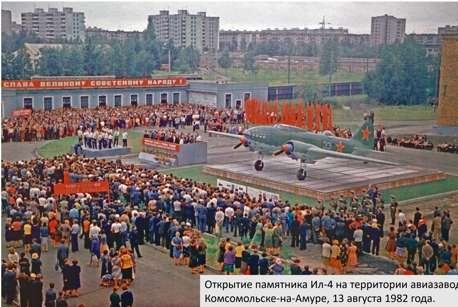
Открытие памятника Ил-4 на территории авиазавода в Комсомольске-на-Амуре, 13 августа 1982 года.