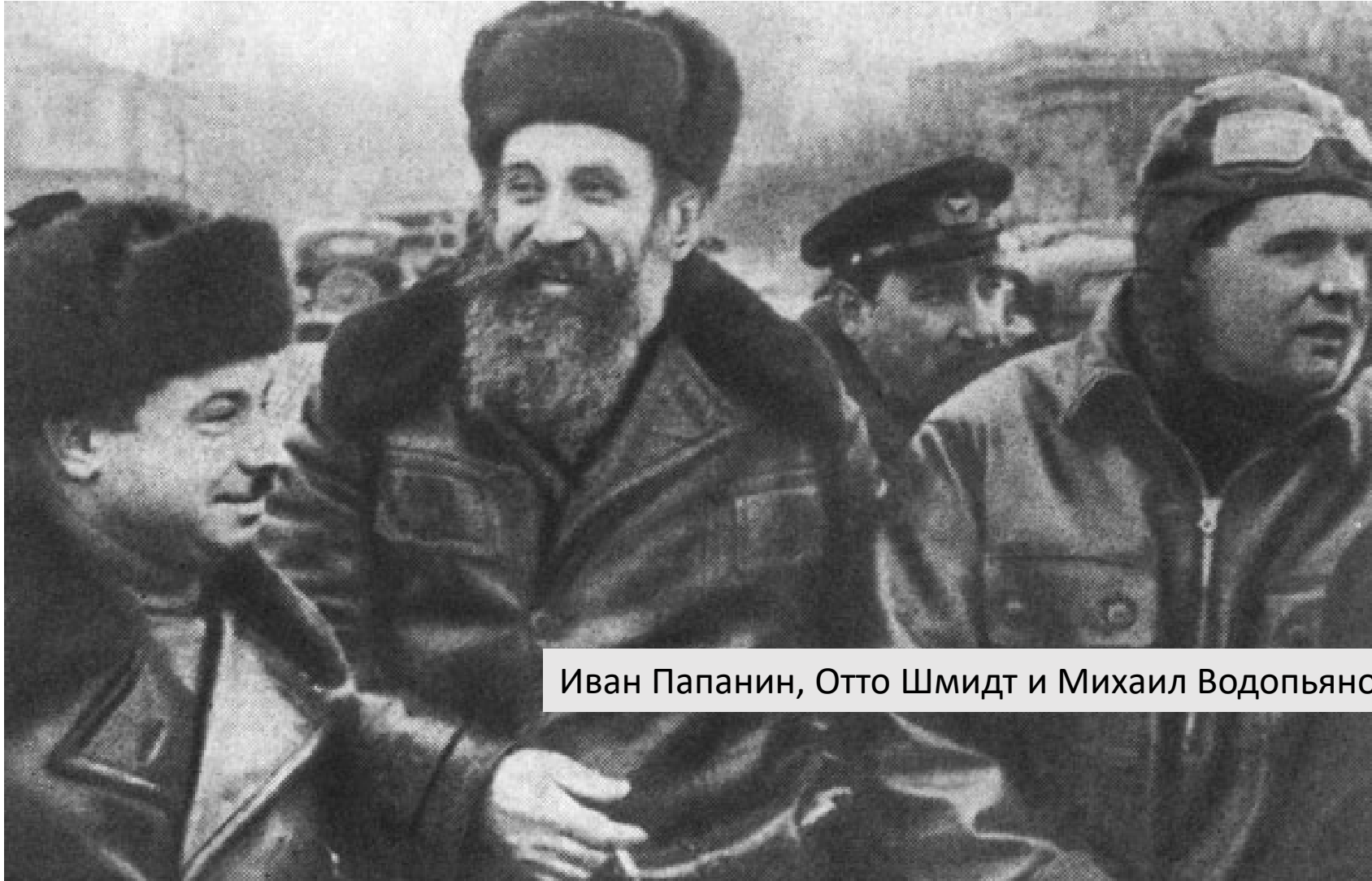
Иван Папанин, Отто Шмидт и Михаил Водопьянов

Справочник первых летчиков на Дальнем Востоке России составлен в алфавитном порядке и будет интересен историкам, краеведам, студентам и школьникам, а также всем интересующимся историей развития авиации на Дальнем Востоке. Справочник не претендует на всеобъемлемость и новые исследователи смогут его дополнить.