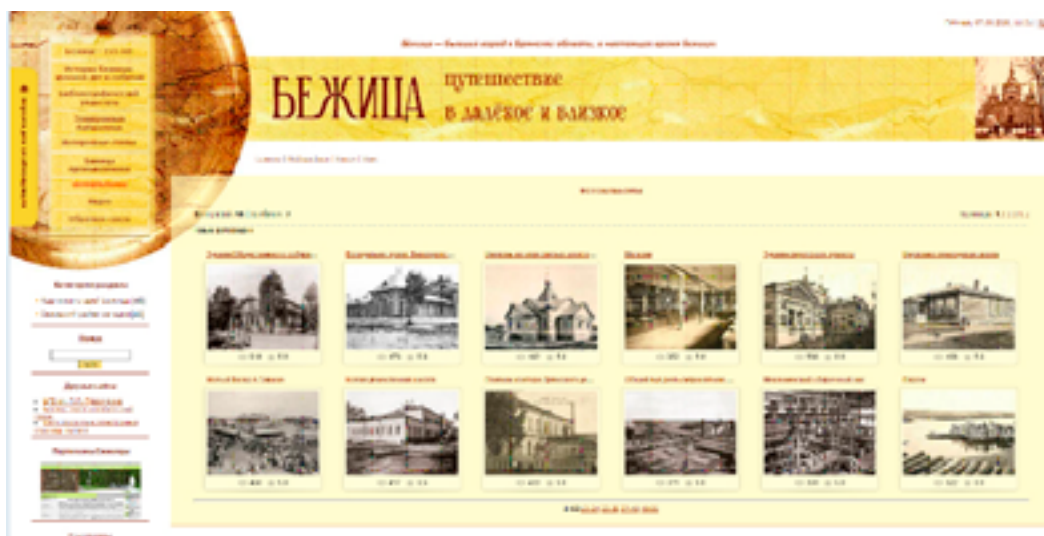
Страница краеведческого ресурса «Бежица: путешествие в далёкое и близкое».

«...Вспоминая родную землю, землю детства и юности, давшую счастье жизни, счастье борьбы и познания, человек не может оставаться спокойным, и душа его охвачена тягой возвращения к своим истокам; в нем как бы оживают смутные голоса ушедших веков и поколений, и, чем сильнее этот зов, тем прочнее связи человека с родной землей, с прошлым, настоящим и грядущим — с тем, что принято определять коротким и необычайно емким по смыслу словом Родина» [6], — писал Пётр Проскурин, и об этом, конечно, думали авторы ещё одного краеведческого ресурса нашего учреждения «Бежица: путешествие в далёкое и близкое» [1], с помощью которого можно узнать об этапах возникновения и становления рабочего посёлка, позже ставшего самым крупным районом города Брянска.