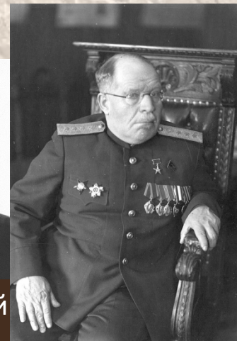
Бурденко Н. Н.