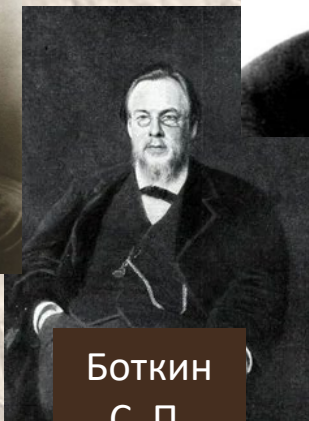
Боткин С. П.