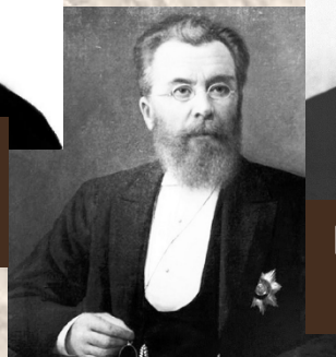
Склифосовский Н. В.