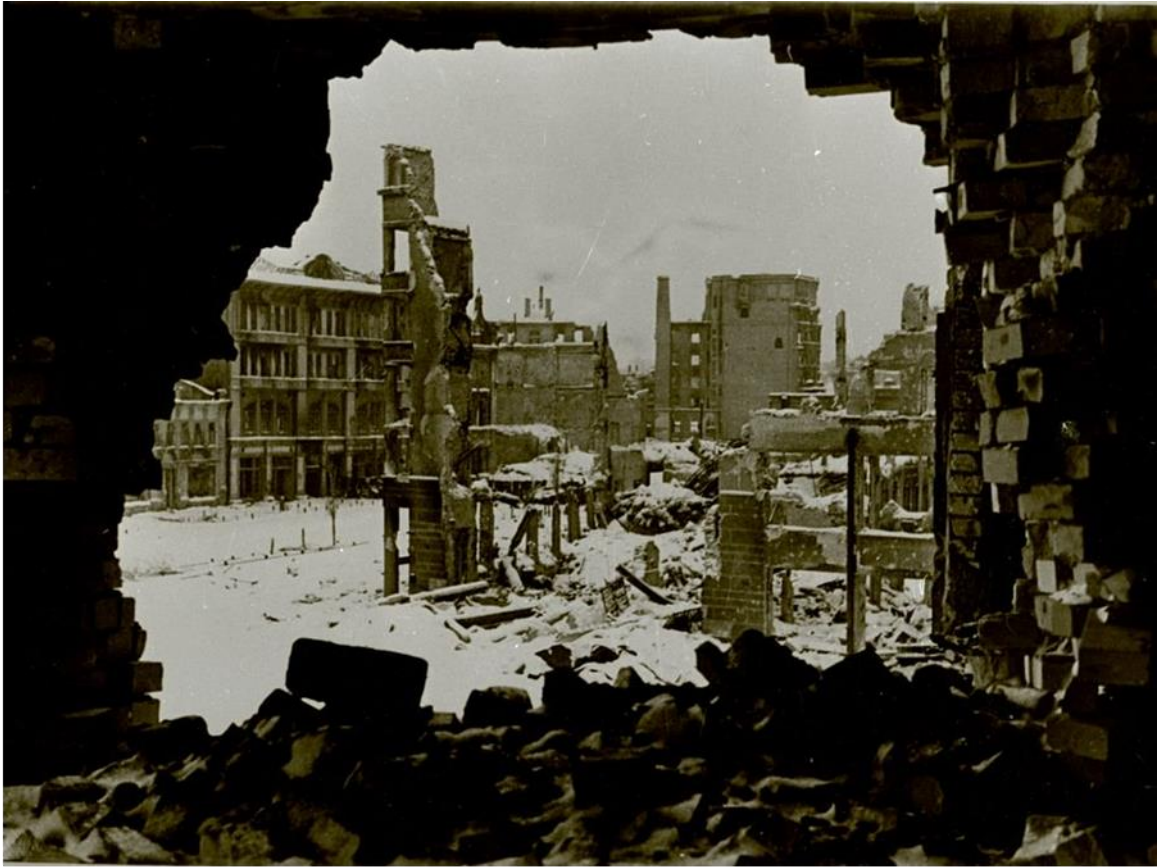
Вид на Мамаев Курган после боя. Декабрь 1942 г. Российский государственный архив кинофотодокументов. Арх. № 0-144827. Фотограф Г. Зельма