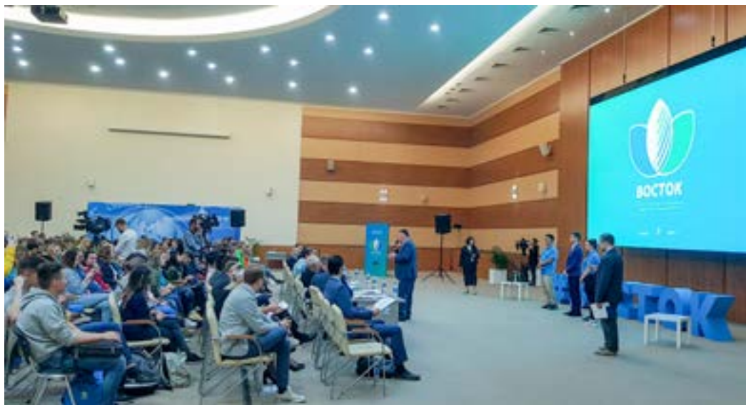
Защита коммерческих проектов.

«Заповедники онлайн» — это мультимедийная общедоступная база данных заповедников, национальных парков и заказников Хабаровского края. База данных для будущих пользователей будет представлена в виде сайта с разделами, где будет собрана подробная информация об особо охраняемых природных территориях, включая фото и видеоконтент, карты и другие мультимедийные материалы. Данный краеведческий электронный ресурс будет разработан с целью повышения экологического просвещения молодёжи и повышения интереса к заповедным территориям Хабаровского края. Сайт «Заповедники онлайн» будет запущен к июню 2020 года.