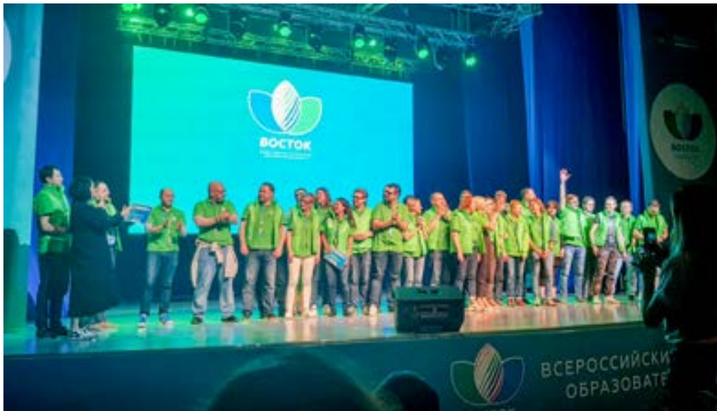
Трееры форума «Восток» в Синем зале.

За каждой «двадцаткой» был закреплён свой волонтер, который занимался всеми организационными вопросами и сопровождал свою группу на все мероприятия. В случае возникновения каких-либо вопросов, он максимально оперативно их решал. Волонтер всегда был на связи, можно сказать, круглосуточно. Каждый вечер волонтер собирал свою «двадцатку», и все высказывались, что понравилось и что не понравилось в пройденном дне. После этого волонтеры собирались все вместе, обсуждали и доводили эту информацию до сведения организаторов. Если возникали какие-то проблемы или недовольства, то их старались устранить в максимально короткий срок. Нам, участникам, были заметны эти изменения со стороны. Волонтеры были связистами между нами и организаторами форума. Это важно, когда тебя слышат и моментально реагируют.