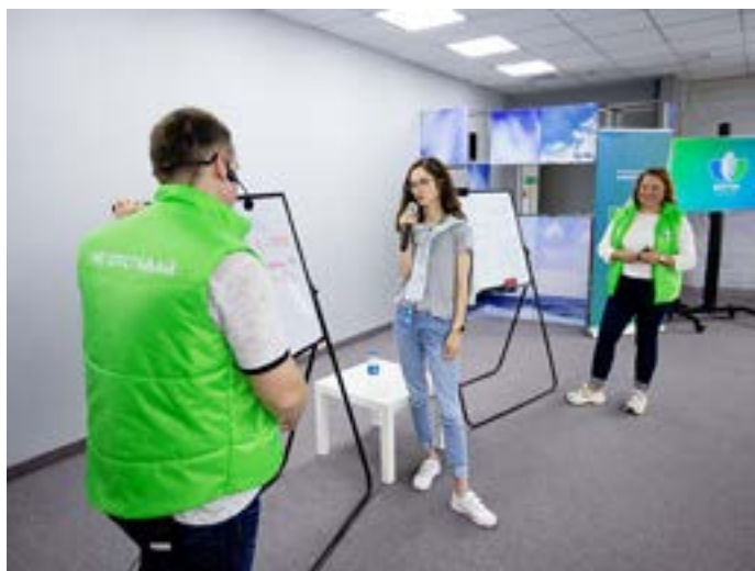
Лаборатория по направлению «финансы».

Ещё одной важной частью дня были проектные лаборатории. Это семинары и мастер-классы, которые поделены на определённые сферы деятельности,