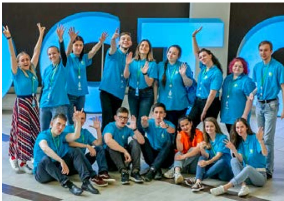
«Двадцатка» № 14 на площадке у маяка.

Площадкой, на которой расположился форум, стал Дальневосточный федеральный университет (ДВФУ). Стоит отметить, что условия проживания и обучения были очень комфортабельными. Участникам не приходилось задумываться об элементарных бытовых вещах — было полное обеспечение всеми необходимыми вещами для проживания и питания. Размещение происходило по два человека в комнате. Интересно, что переселение из комнаты в комнату было строго запрещено по правилам форума. Организаторы заранее предусмотрели этот вопрос, что многим захочется видеть рядом знакомого и близкого. А одной из целей форума было налаживание связей между молодёжью со всех регионов Российской Федерации. И тогда искусственно создали ситуации, в которых люди знакомились и общались.