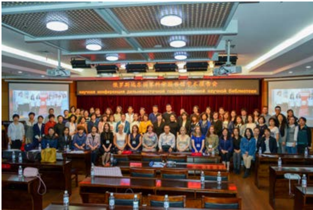
Участники Международного библиотечного форума «Хэйлуцзянская провинция — Хабаровский край».