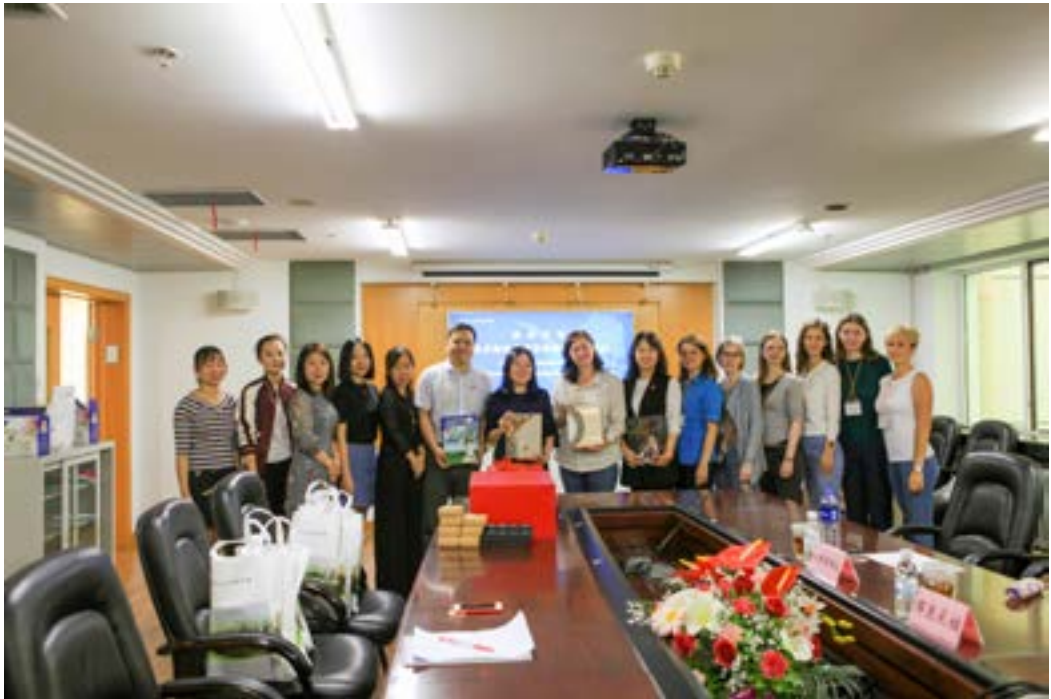
Делегация ДВГНБ и коллеги из ХПБ на церемонии дарения книг.

С 9 по 13 сентября делегация Дальневосточной государственной научной библиотеки (ДВГНБ) посетила с рабочим визитом Хэйлунцзянскую провинциальную библиотеку (ХПБ, г. Харбин, КНР). Уже на протяжении нескольких лет наши учреждения ежегодно обмениваются подобными визитами в рамках соглашения о сотрудничестве между ДВГНБ и ХПБ, подписанного 18 сентября 2009 года. Вот краткая хроника нынешней нашей поездки.