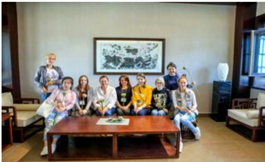
В вегетарианском ресторане на острове лотосов.

Ещё в этот день мы посетили книжный магазин имени Гоголя. В Китае очень популярны пять наших отечественных писателей: Гоголь, Горький, Островский, Пушкин и Чехов. В Харбине магазин Гоголя находится на одноимённой улице. Нужно отметить, что магазин пользуется популярностью у местных жителей, и это неудивительно: уютные пространства, большой выбор книг, возможность поработать за столом и почитать книгу с полки прямо здесь, сидя на полу или удобных лавочках. Очень много родителей читают книжки своим маленьким детям прямо в магазине.