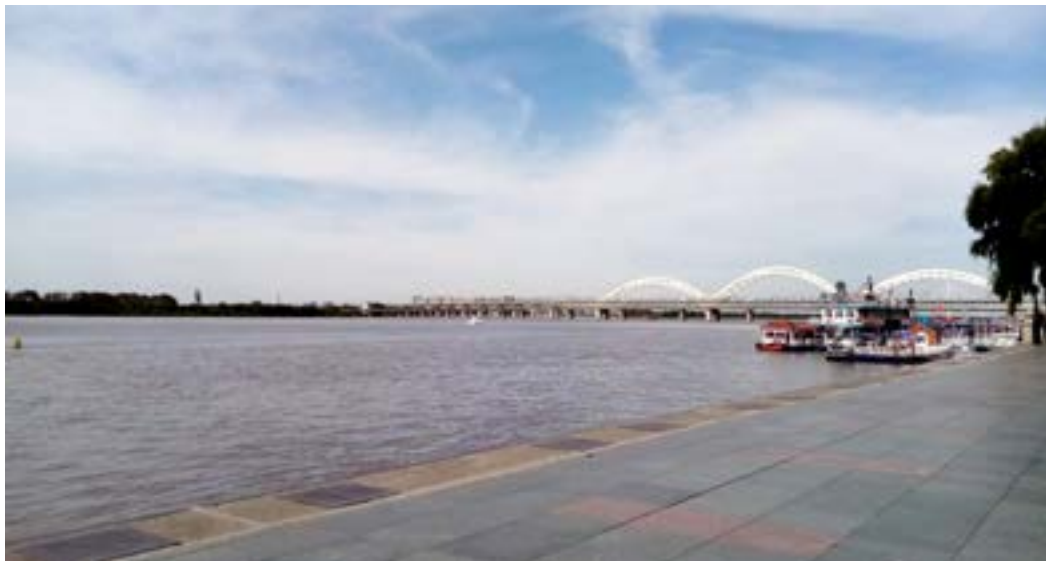
Набережная реки Сунгари.