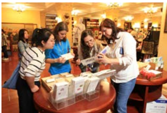
В книжном магазине имени Гоголя. Члены делегации рассматривают открытки с видами Харбина.

Далее мы посетили Музей провинции Хэйлуцзян. Здесь есть несколько залов: зал природы провинции, где представлены экспонаты от костей динозавров, найденных на территории провинции, до современных представителей фауны; зал древней истории, племён джурджений, их быта, предметы одежды, украшения и многое другое. Самый большой зал посвящён русской эмиграции и строительству КВЖД — здесь представлены предметы быта, на информационных стендах — фотографии и рассказы о выдающихся личностях, макеты старинных зданий, реконструкции комнат. Это самый