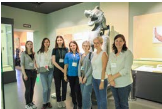
Делегация ДВГНБ в Музее провинции Хэйлуцзян.

почти за каждым столом учатся студенты (это весьма распространённая практика в Китае). Нужно отметить большое количество пожилых людей в библиотеке — для них здесь есть разного рода активности. Так, в одном из залов была организована литературная встреча, где декламировались стихи и отрывки из произведений. В учебной комнате проходил урок каллиграфии — все желающие пишут чхэнъюи (высказывания из четырёх иероглифов) или просто тренируются в красивом письме. Но что поразило нас больше всего, так это салон русского языка, где не только учат русский язык, но и уделяют большое внимание изучению русских песен. Как сказал один из участников, «в русских песнях есть душа, это нужно помнить». В итоге мы все вместе спели «Катюшу».