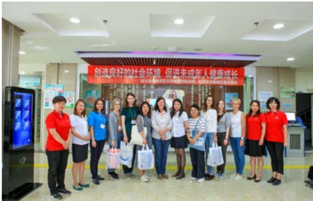
В библиотеке района Наньган. Сотрудники библиотеки, ХПБ и делегация ДВГНБ.