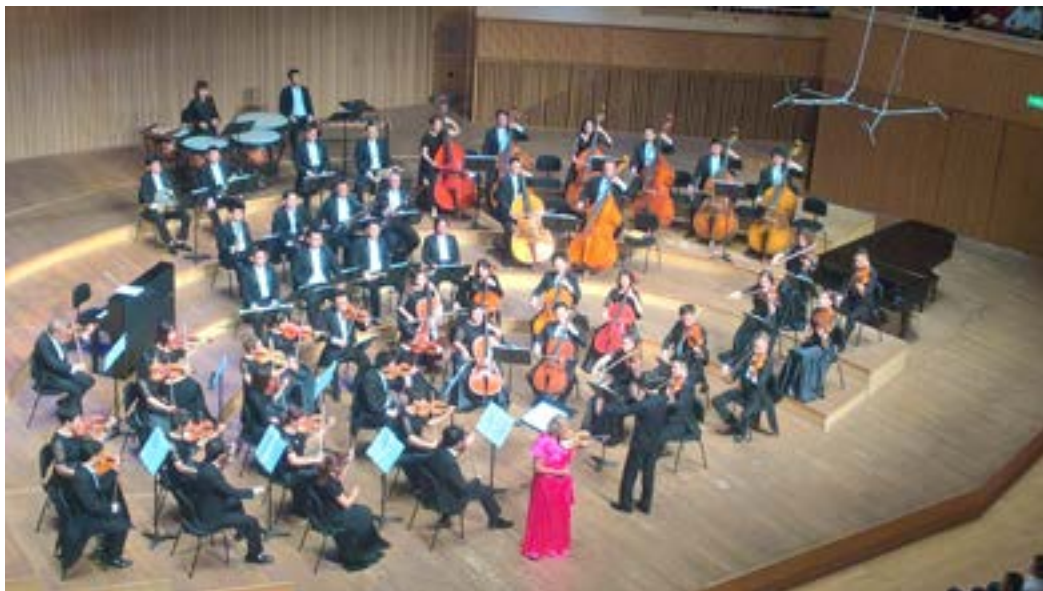
На выступлении Харбинского симфонического оркестра (дирижёр — Юй Сюэфэн, первая скрипка — Ела Спиткова).

После обеда для нас была организована экскурсия на центральную улицу Харбина, также мы побывали на набережной реки Сунгари, увидели поющие фонтаны, прогулялись по Арбату, полюбовались архитектурой старинных зданий и, конечно же, увидели Софийский собор. Нам повезло, и фонтаны перед собором работали!