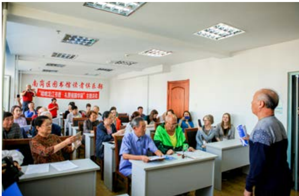
Участники салона русского языка в библиотеке района Наньган.