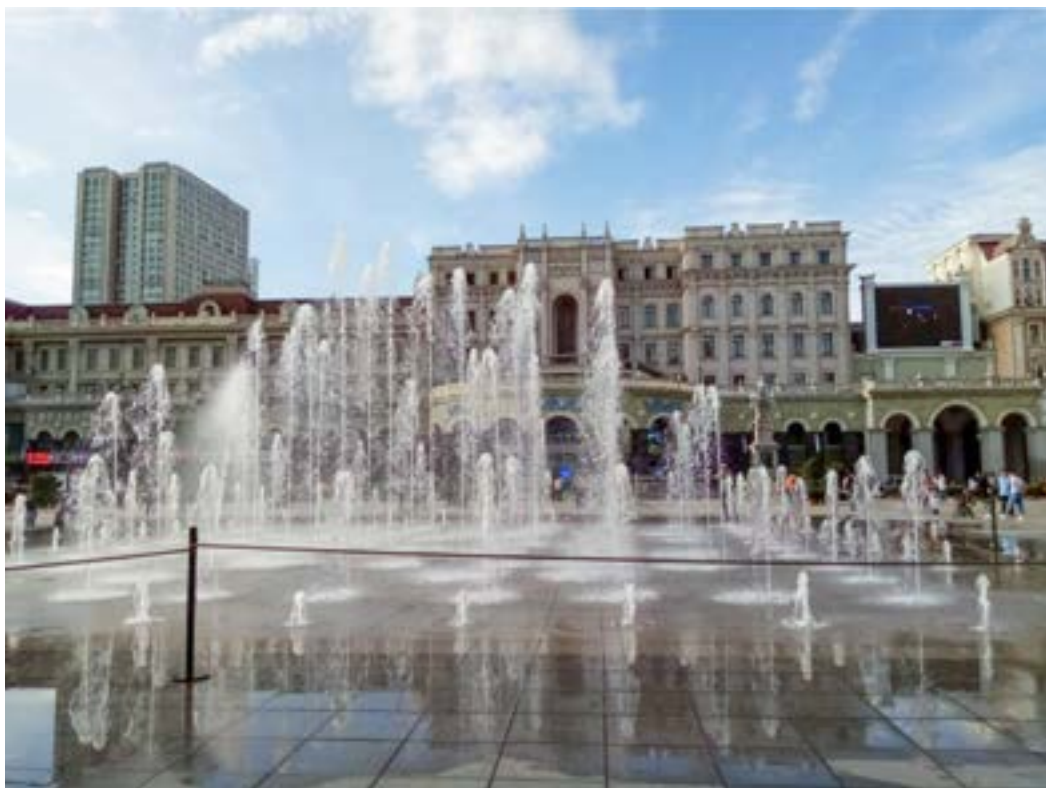
Фонтаны перед Софийским собором.